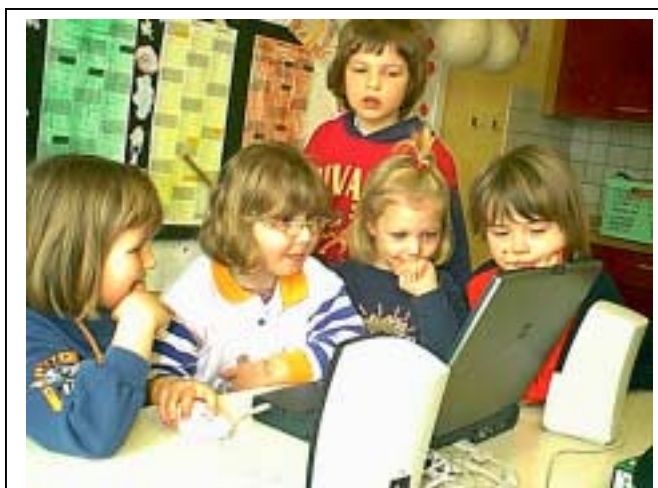
PC-Projekt im Kindergarten